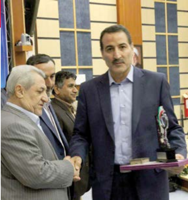
● اداره کل فنی و حرفه‌ای دستگاه برگزارنده در شاخص‌های عمومی جشنواره شهید رجایی

حداقل ۵۰ درصد بیکاران هیچ مهارتی ندارند و افراد با مدرک تحصیلی لیسانس و فوق لیسانس هیچ مهارت فنی ندارند.