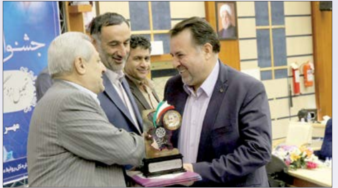
تقدیر استاندار از مدیرکل اقتصاد بعنوان دستگاه برتر در جشنواره شهید رجایی

داریم که امیدواریم به کمک پارک علم و فناوری بتوانیم حلقه های مفقوده را شناسایی کنیم. مرکز خدمات سرمایه گذاری پنجره واحد سرمایه گذاری و کانون مراجعه کنندگان سرمایه گذاری است.